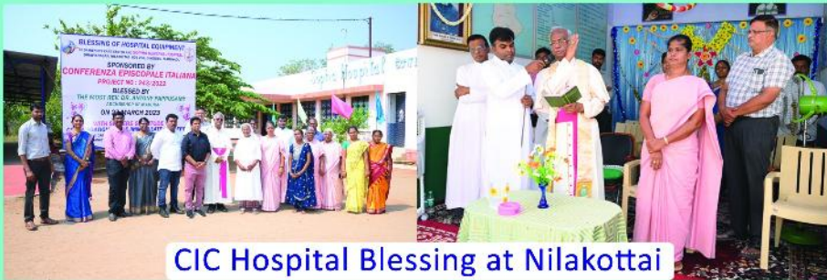
CIC Hospital Blessing at Nilakottai