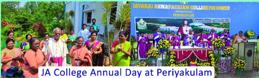
JA College Annual Day at Periyakulam