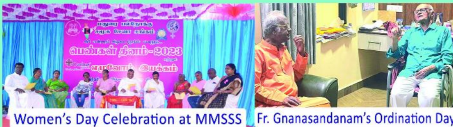
Women's Day Celebration at MMSS