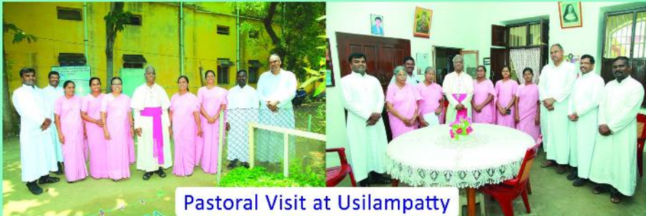
Pastoral Visit at Usilampatty