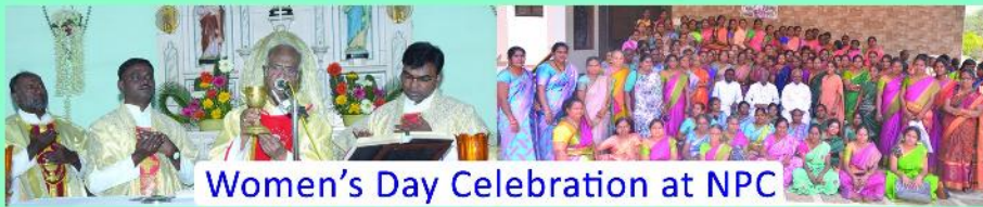
Women's Day Celebration at NPC