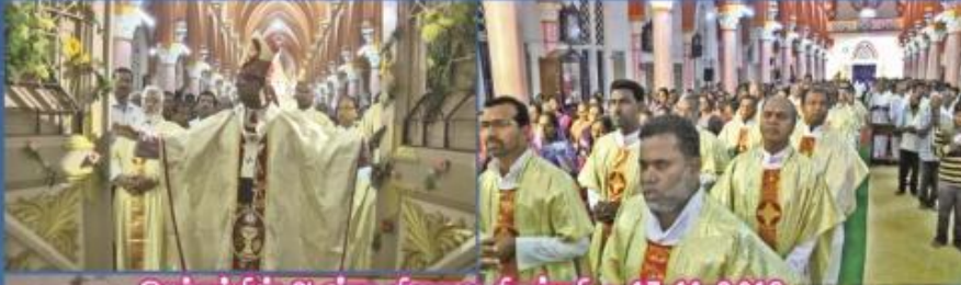
இரக்கத்தன் ஆண்டு-நிறைவு திருப்பல் - 13.11.2016