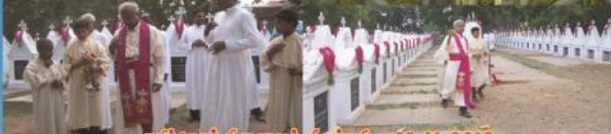
மர்த்தோர் நனைவுத் திருப்பல் - 08.11.2016