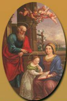
Sts. Joachim and Anne July 26 th