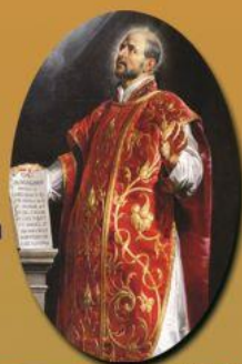
St. Ignatius of Loyola July 31 st