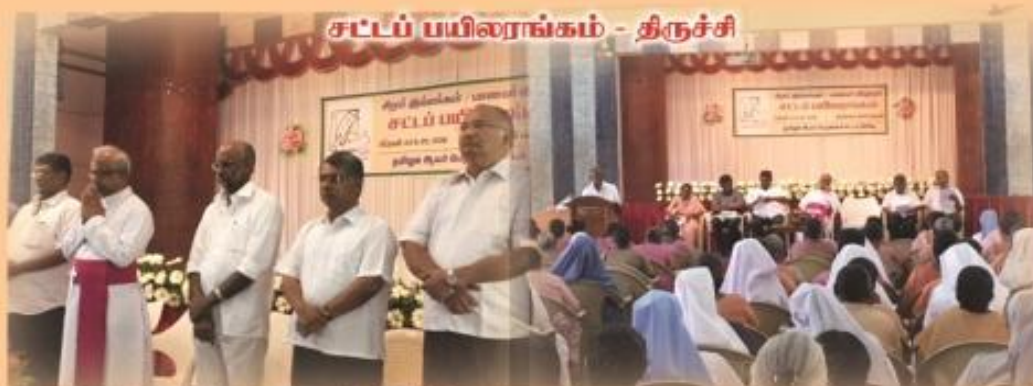
சட்டப் பயிற்சாங்கம் - திருச்சி