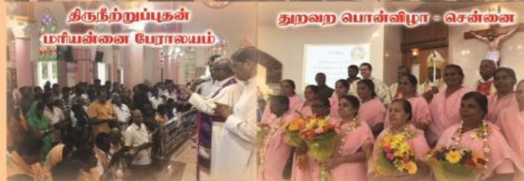
திருநீற்றுப்புகள் மரியன்னை பேராலயம்