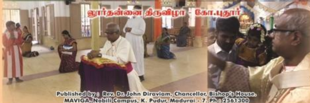
லூர்தன்னை திருவிழா - கோ.புதூர்