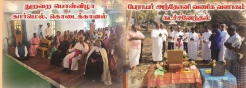
துறவற பொன்விழா கார்மெல், கொடைக்கானல்